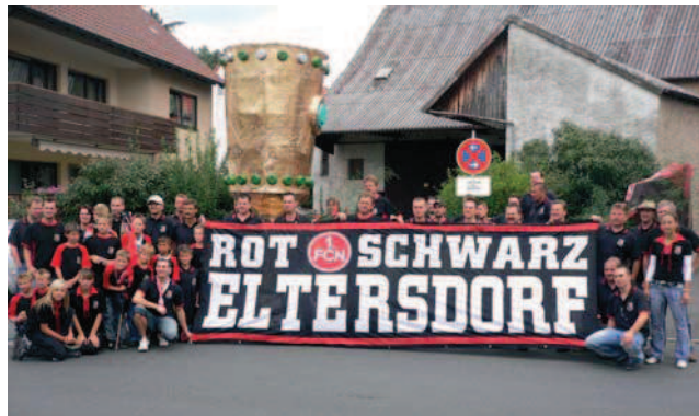
Der Fan-Club Rot-Schwarz Eltersdorf. Im Hintergrund der Pokal in Übergröße.

Für prickelnde Auftritte: VOM WASSER DAS BESTE®